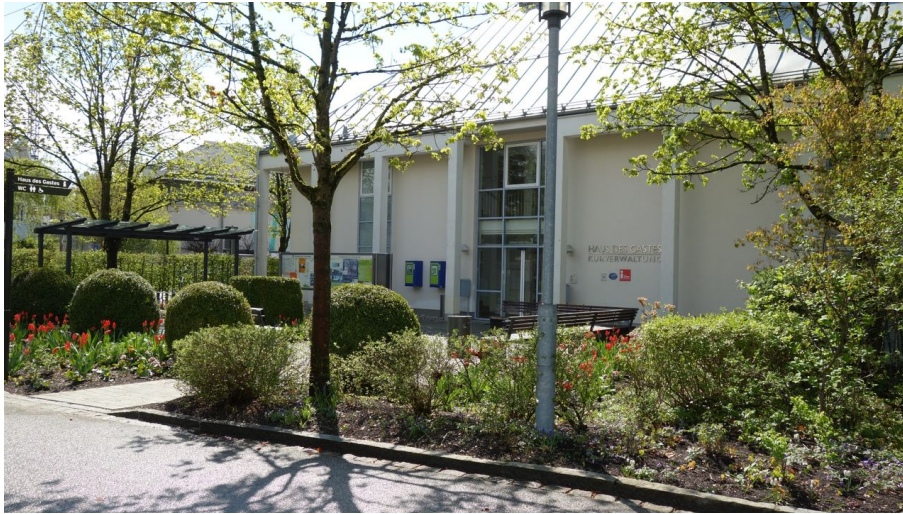
Haus des Gastes