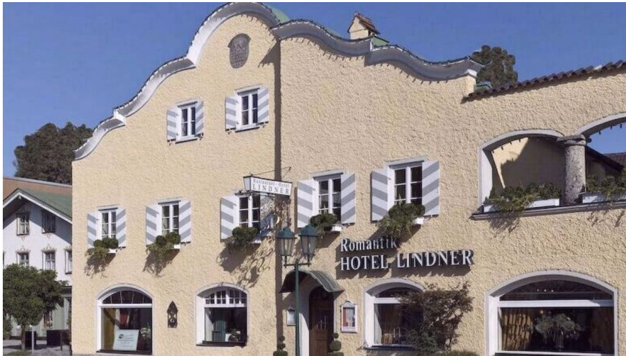
Das Lindner Bad Aibling