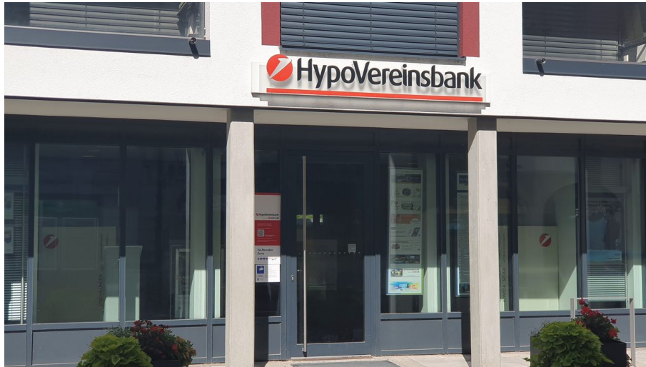
HypoVereinsbank Bad Aibling