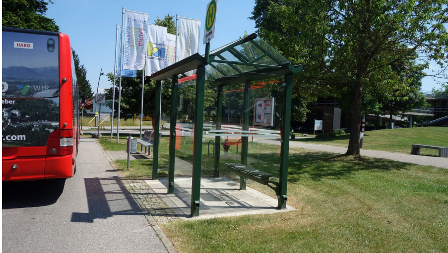
HS1-Moor-Express-Therme-Bad-Aibling