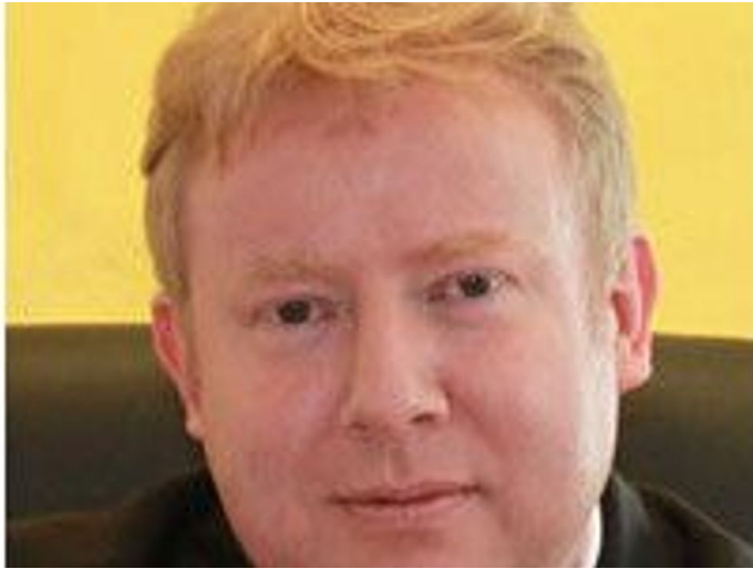
Frank Daudert - © Praxis Daudert