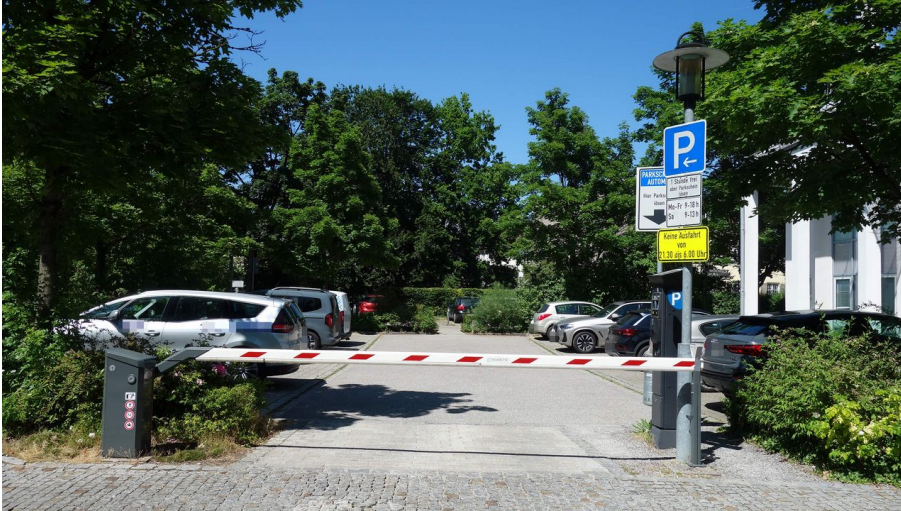
Parkplatz-Haus des Gastes-Bad-Aibling