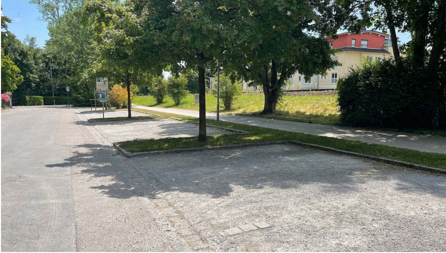
Parkplatz P10 Dr.-Beck-Straße