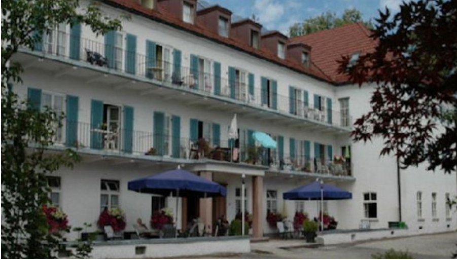
Seniorenheim Höllmüller