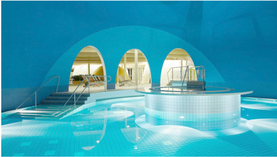
Therme Bad Aibling