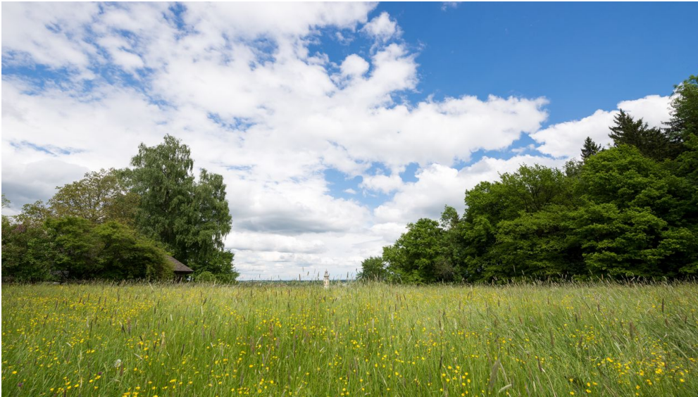
Berbling Panorama - Andreas Jacob