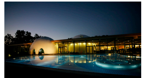
Therme Bad Aibling