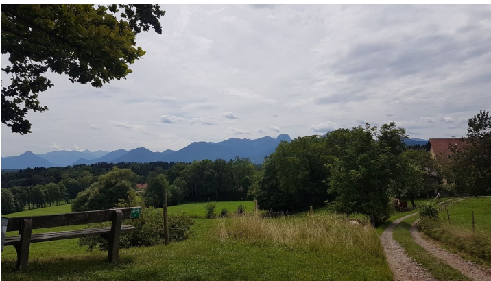
Blick von Haslach - JP