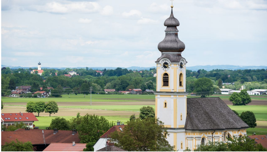
Kirche Hl. Kreuz in Berbling - Andreas Jacob