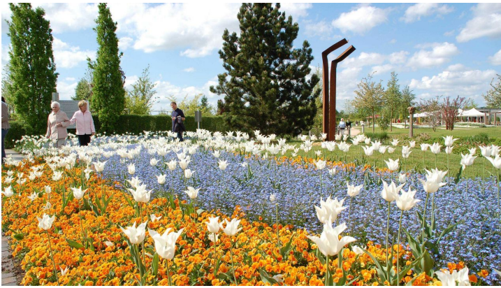
Blumenband Park der Gärten