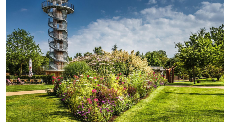
Aussichtsturm im Park der Gärten