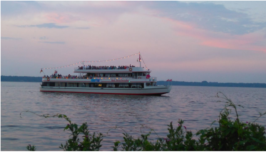
Reederei Herbert Ekkenga AG