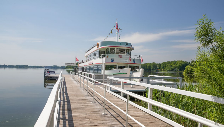
anleger-dreibergen