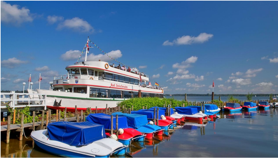
boote-weisse-flotte