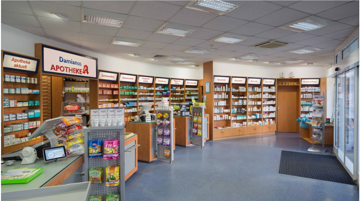
apothke-innen-rechts