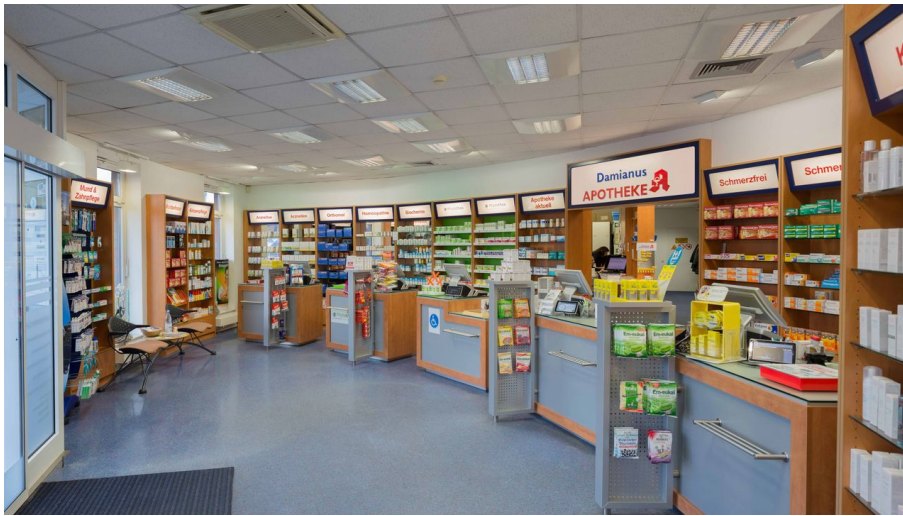
apotheke-innen-links