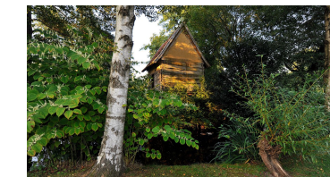
bargfreed - © reinsch-fotodesign_www.reinsch-fotodesign.de