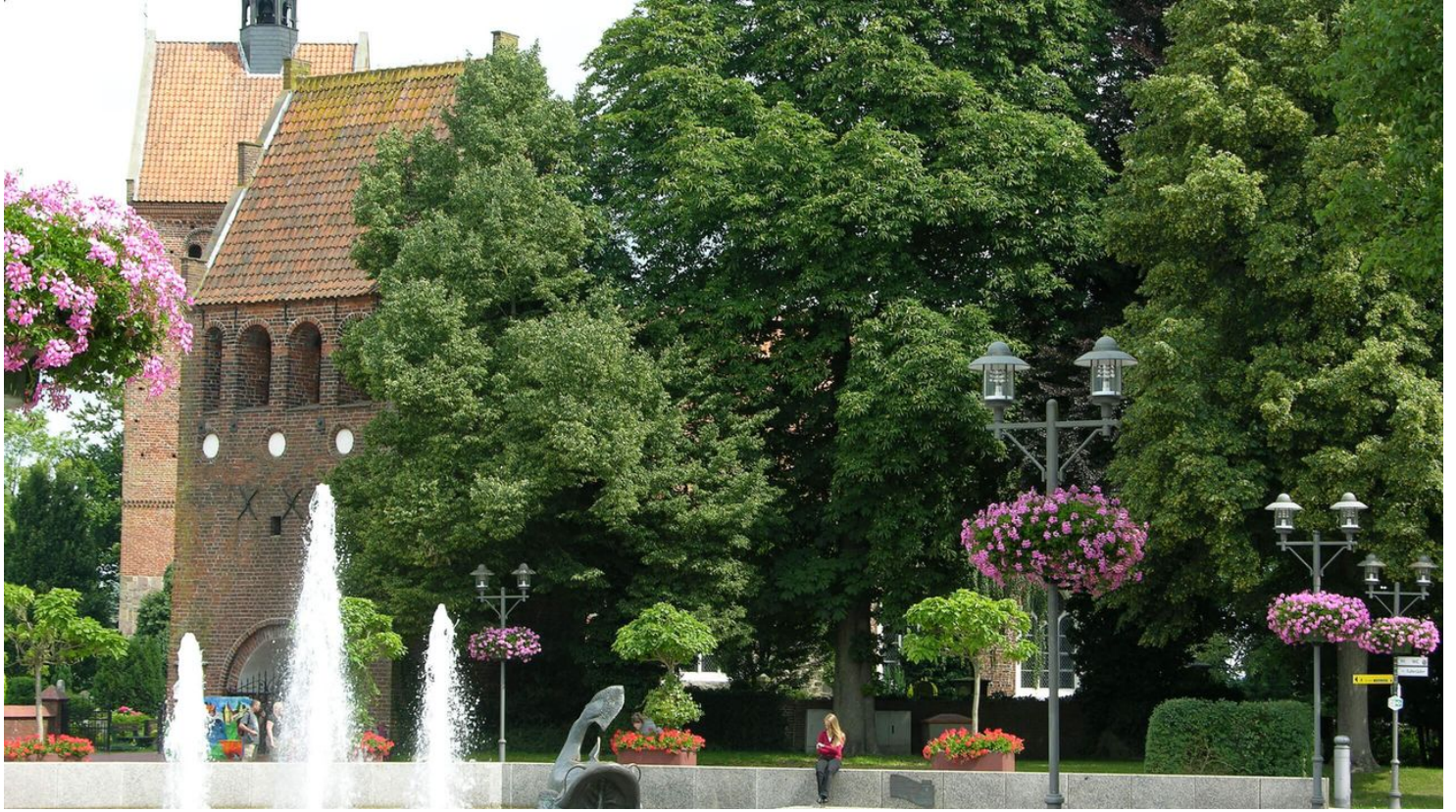
st-johannes-kirche