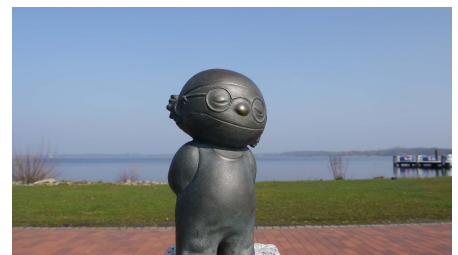
mainzelmaennchen-nah-in-der-sonne