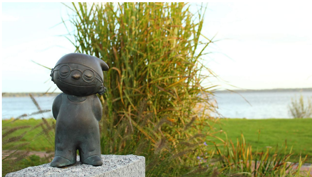
herbst-mainzelmaennchen