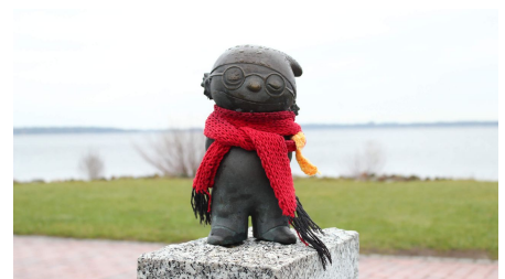
mainzelmaennchen-mit-schal