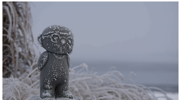
mainzelmaennchen-raureif