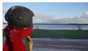
mainzelmaennchen-schnee - - info@bad-zwischenahn-touristik.de