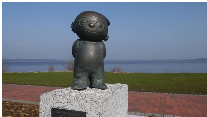
mainzelmaennchen-mit-schild