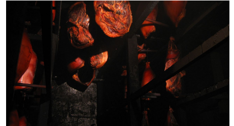
Schinken im Rauch