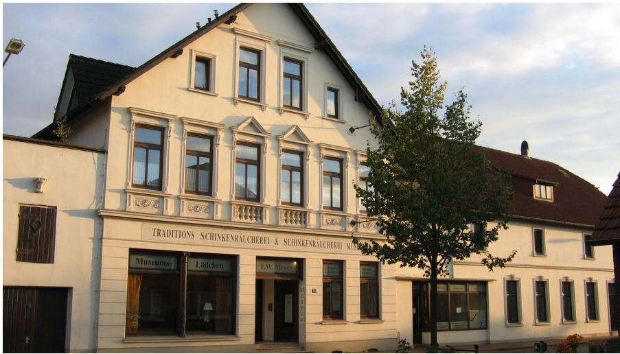
Schinkenmuseum-Apen - © Apen-Touristik