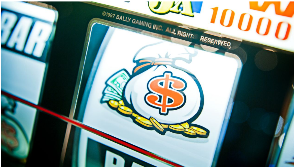
automat - © andre sobott, alwsobott gmbh