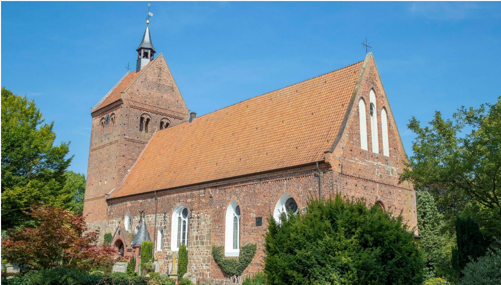
st-johannes-kirche-hinteransicht

Montag - Freitag: 13 - 16 Uhr Samstag: 11 - 16 Uhr Sonntag: 12 - 16 Uhr