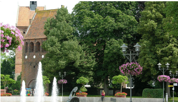
st-johannes-kirche