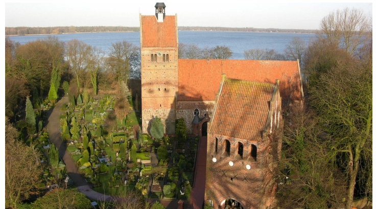
st-johannes-kirche-von-oben