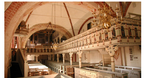
st-johannes-kirche-innen