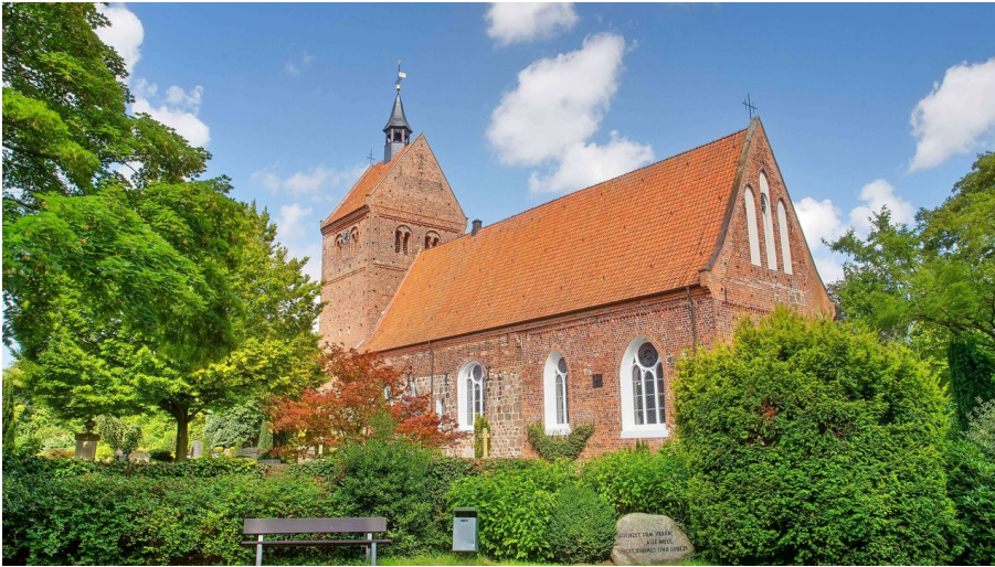
st-johannes-kirche-bad-zwischenahn.jpg - - info@bad-zwischenahn-touristik.de