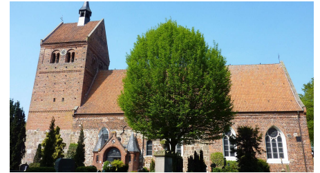
st-johannes-kirche-bad-zwischenahn-aussen