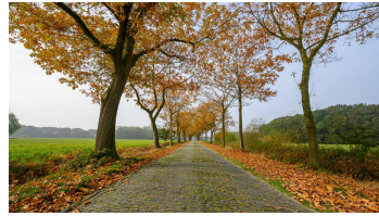
M. Greilich Fotoclub Westerstede, Ostfriesland Tourismus