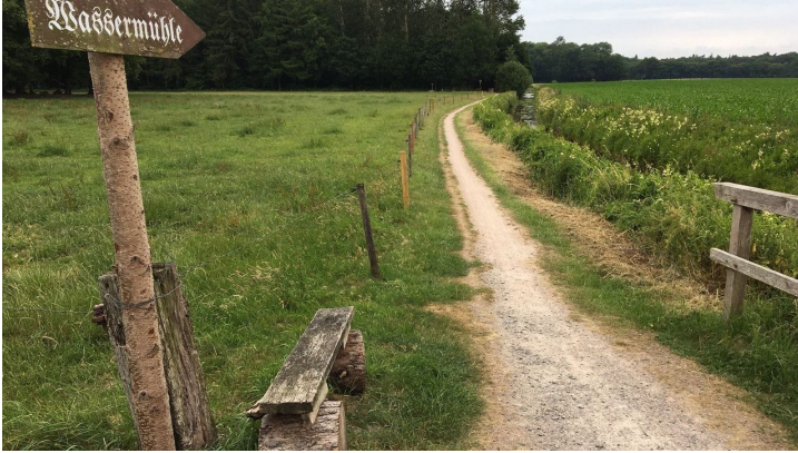
Howieker Wassermühle