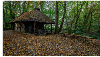
M. Greilich Fotoclub Westerstede, Ostfriesland Tourismus