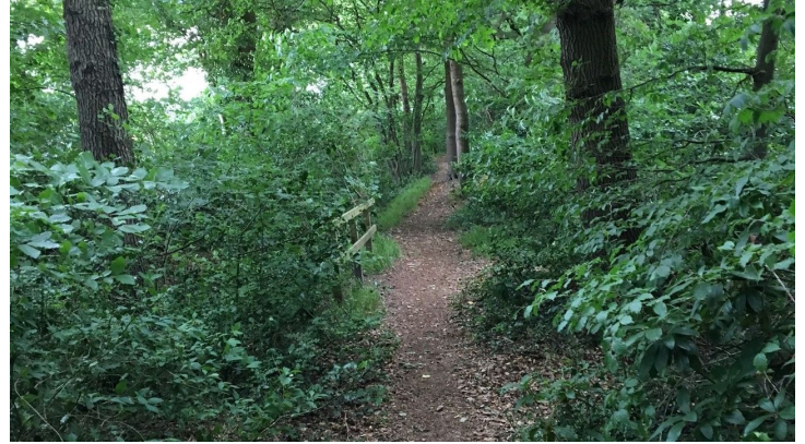
Waldweg Karlshof