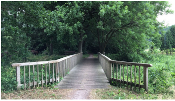
Brücke über Ollenbäke