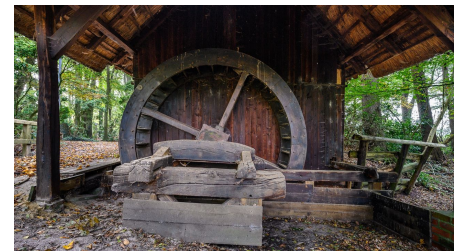
M. Greilich Fotoclub Westerstede, Ostfriesland Tourismus