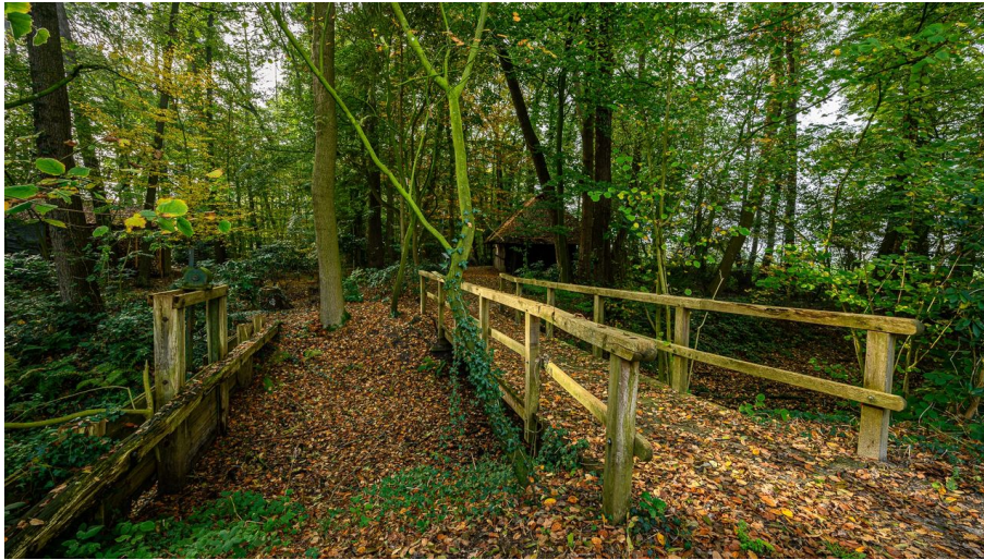
M. Greilich Fotoclub Westerstede, Ostfriesland Tourismus