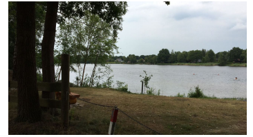
See Karlshof