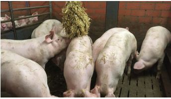
Mastschweine mit Stroh