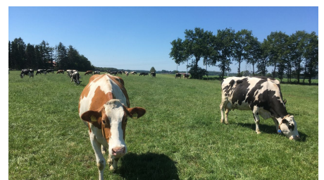
Kühe auf der Weide