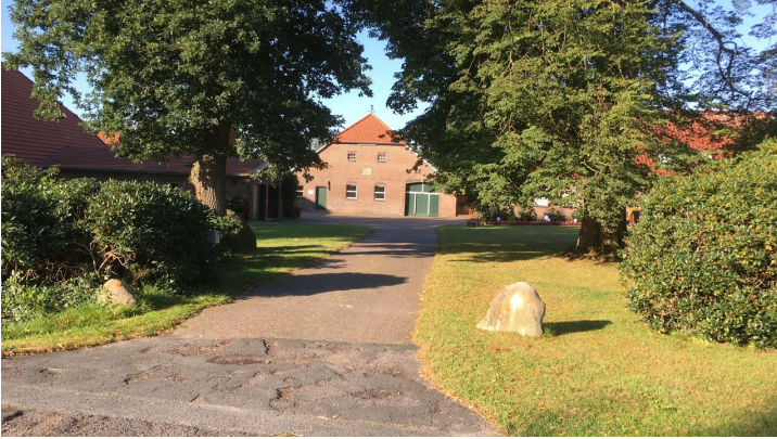
Hof Ahlers