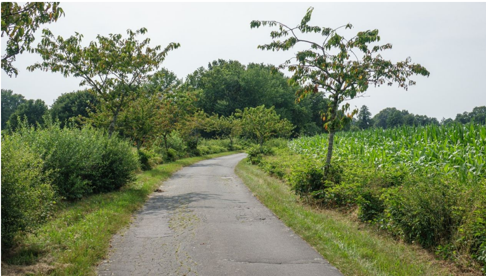
Ammerland Touristik, Ostfriesland Tourismus

Die Übersichtskarte und das Radwanderkartenset mit allen 15 Themenrouten können Sie hier zum Preis von 7,90 € plus Porto bestellen. Die Einzelkarten haben einen Maßstab von 1 : 30.000.