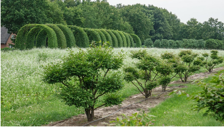
Ammerland Touristik, Ostfriesland Tourismus