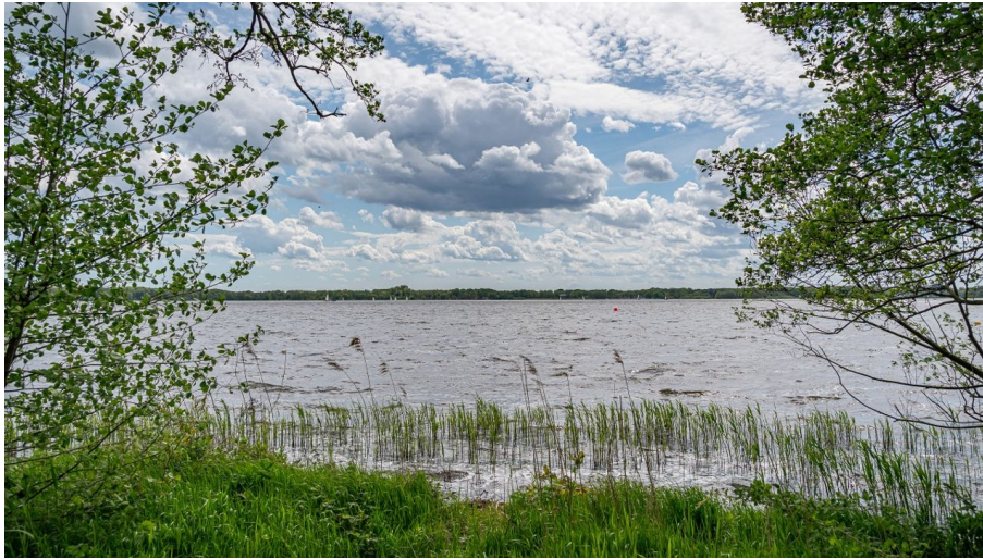
Ammerland Touristik, Ostfriesland Tourismus