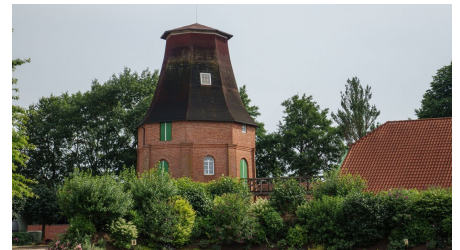
Ammerland Touristik, Ostfriesland Tourismus