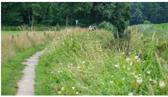
Ammerland Touristik, Ostfriesland Tourismus