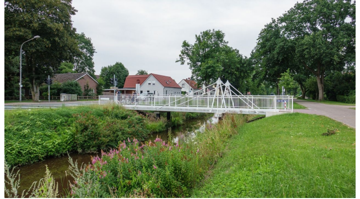
Ammerland Touristik, Ostfriesland Tourismus