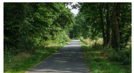
Ammerland Touristik, Ostfriesland Tourismus