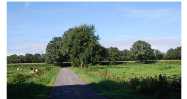
Wold&Woldsee - Streckenabschnitt - © Ammerland Touristik, Ostfriesland Tourismus