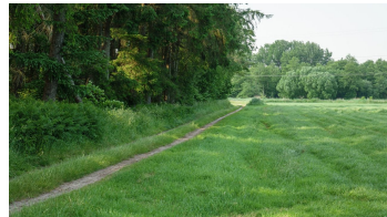
Ammerland Touristik, Ostfriesland Tourismus