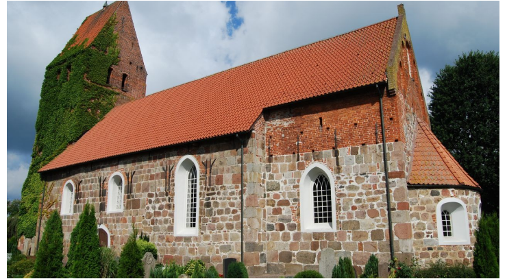
Kirche in Wiefelstede