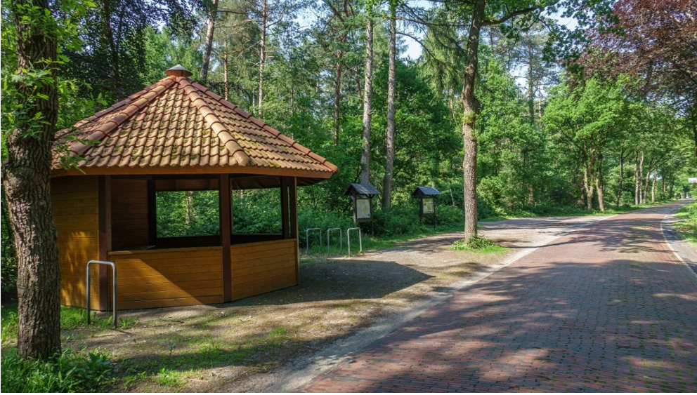
Ammerland Touristik, Ostfriesland Tourismus