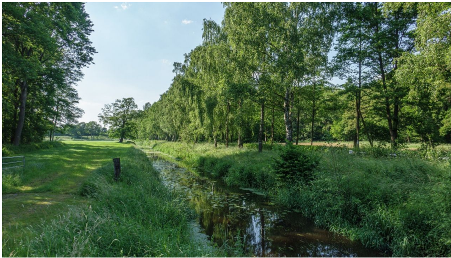
Ammerland Touristik, Ostfriesland Tourismus