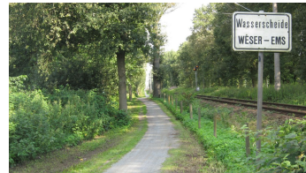
Wold&Woldsee - Streckenabschnitt