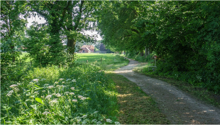
Ammerland Touristik, Ostfriesland Tourismus