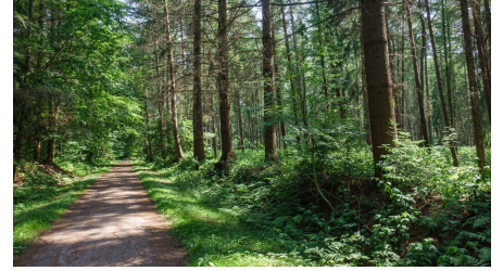
Ammerland Touristik, Ostfriesland Tourismus