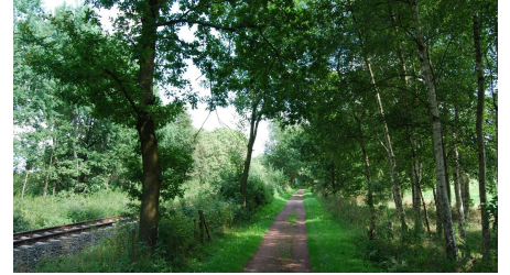
Wold&Woldsee - Streckenabschnitt