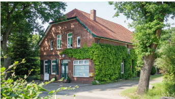
Ammerland Touristik, Ostfriesland Tourismus