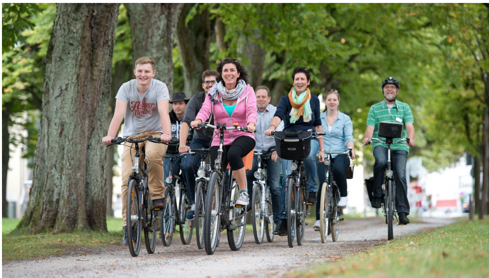
Stadtführungen per Fahrrad in Oldenburg