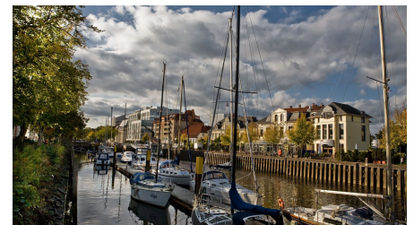
Alter Stadthafen Stau in Oldenburg