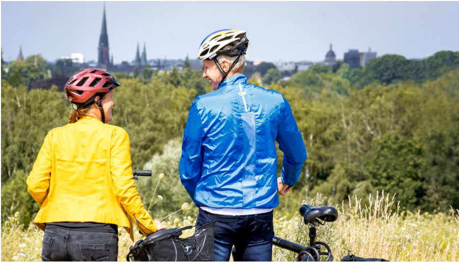
Radfahren auf der Route um Oldenburg