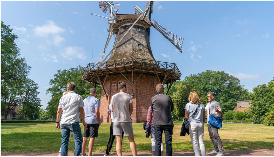
mühle.jpg