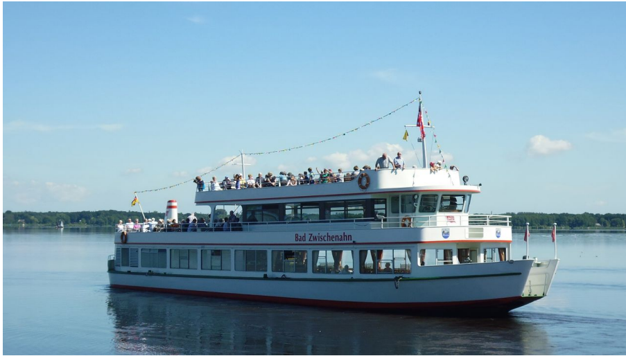
MS Bad Zwischenahn.jpg