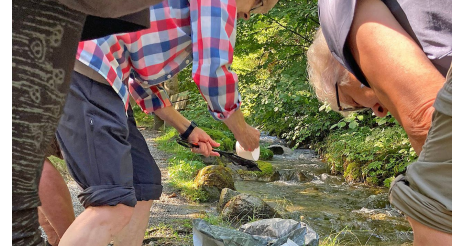
Forschen an der Quelle