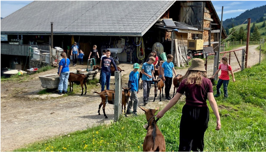
Ziegen und Kinder auf Alp Hösel