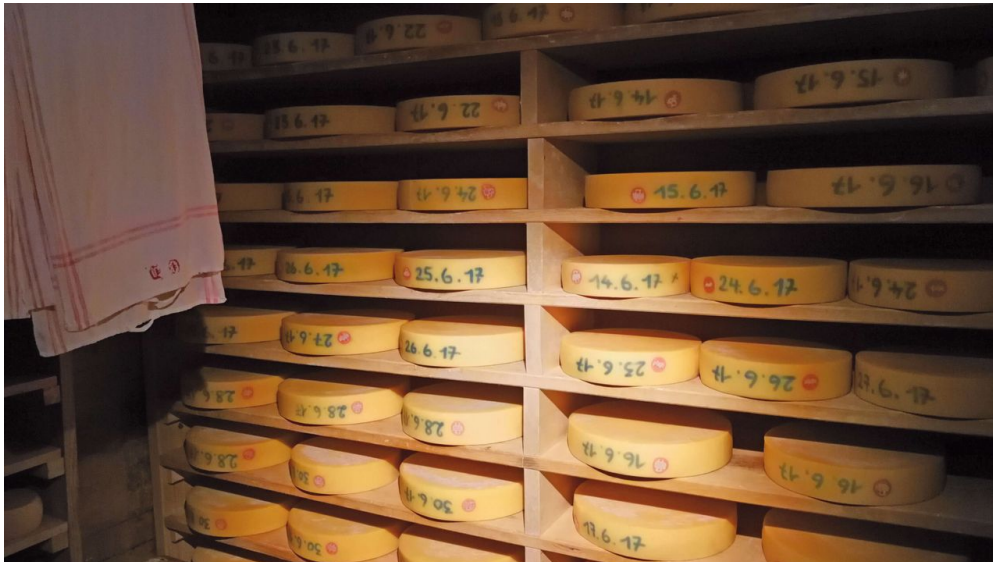
The cheese cellar at Alp Hösel

Erwachsene Fr. 40, Kinder (-15 J.) Fr. 10