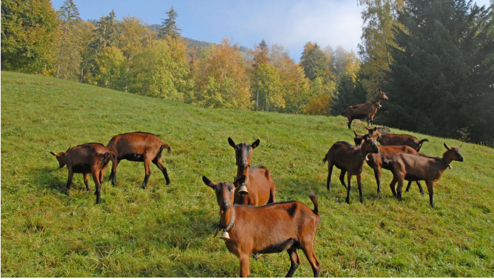
The brown goats on the «Hösel» Alp