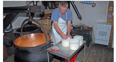
The alpine dairyman making cheese