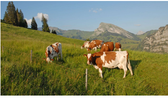
Animal inhabitants of the alp