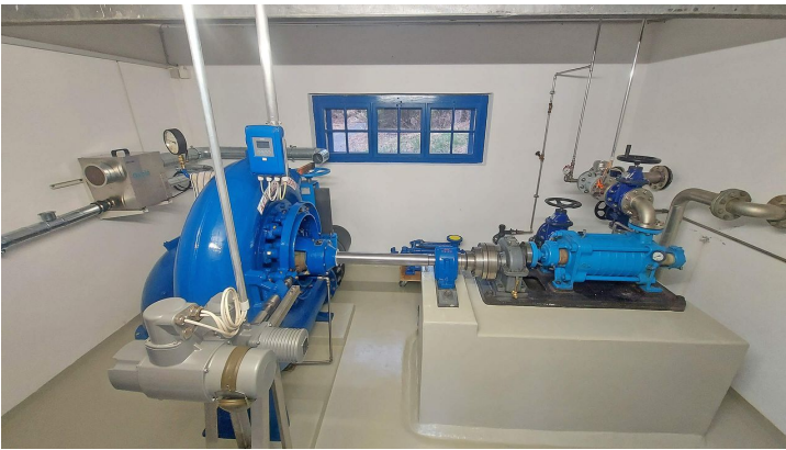
Das Maschinenhaus der Trinkwasserversorgung