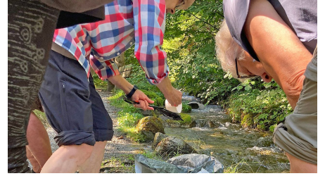
Forschen an der Quelle