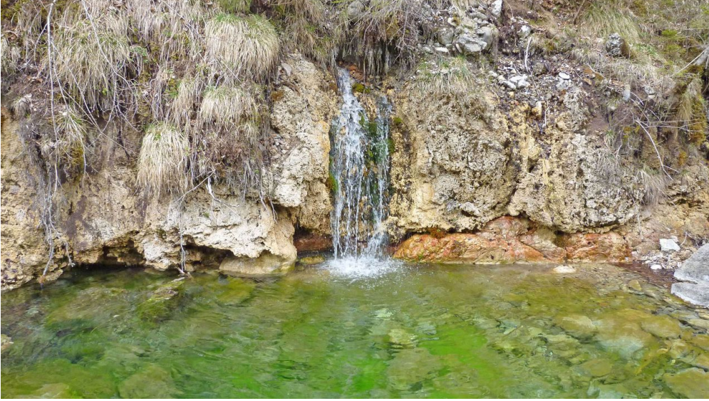
Schwarzbach Quellen im Naturpark Diemtigtal