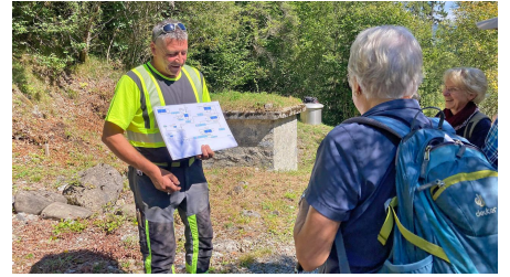
Der Brunnenmeister erklärt das Trinkwassersystem