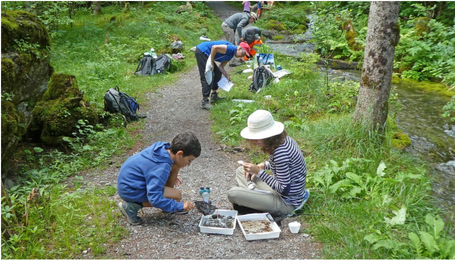
Den Lebensraum Quelle erforschen