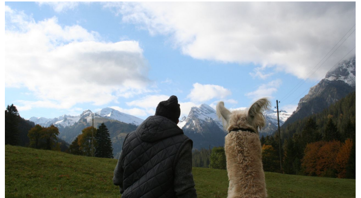
Auch die Lamas geniessen die schöne Aussicht