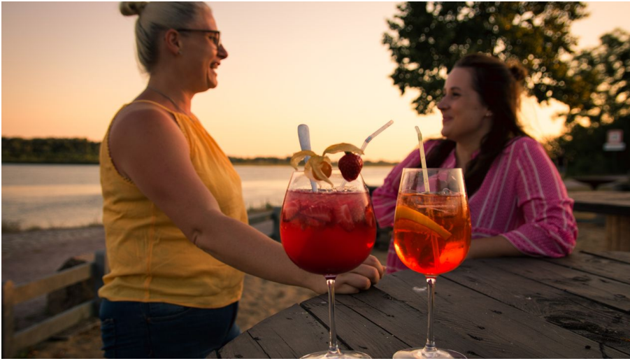
Beachlounge Geesthacht am Abend mit Elbblick