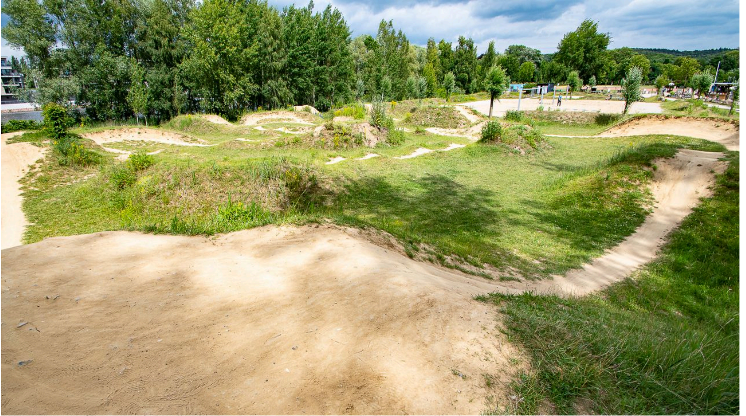
Fahrradparcour an der Dirt-Bike-Strecke