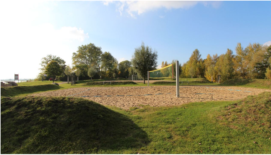
Beachvolleyball direkt an der Elbe