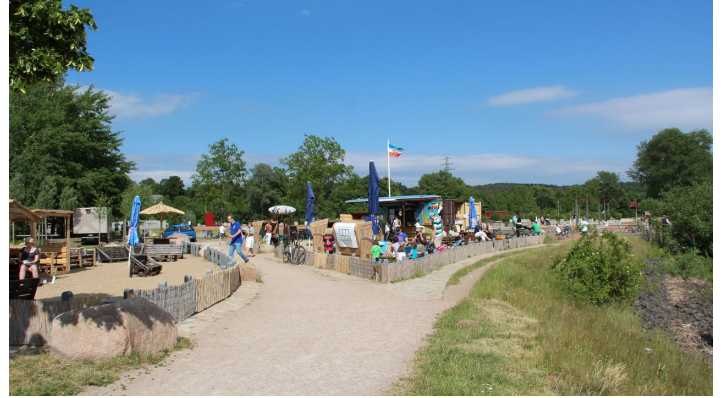
Beachlounge direkt an der Elbe