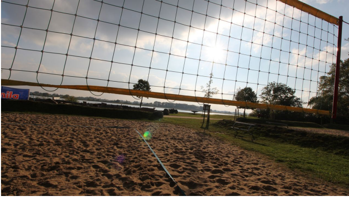
Beachvolleyball direkt an der Elbe