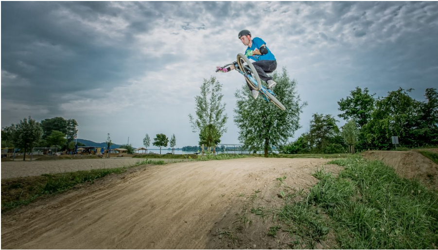
Fahrradparcour an der Dirt-Bike-Strecke