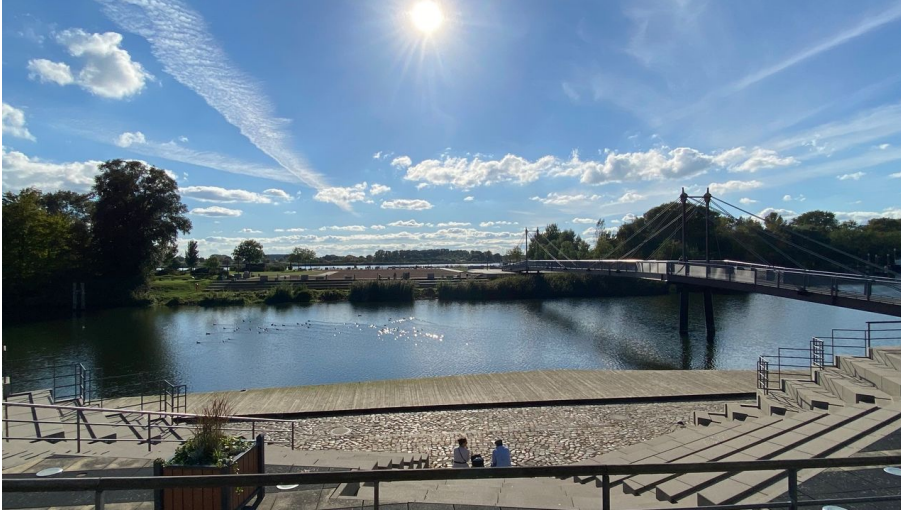
Hafen Geesthacht