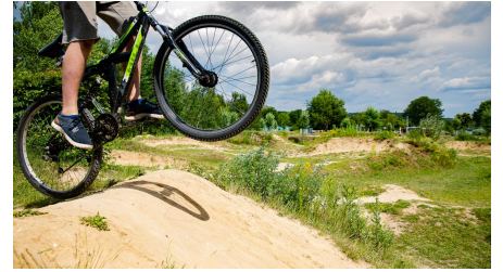
Fahrradparcour an der Dirt-Bike-Strecke