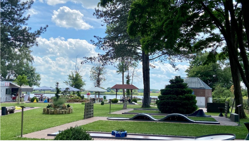
Minigolf spielen mit Elbblick