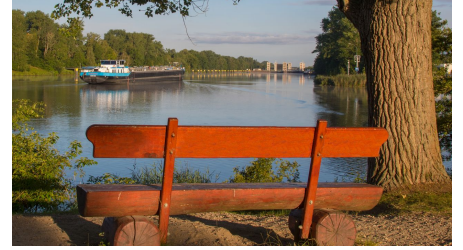
Schleusenblick am Wanderweg