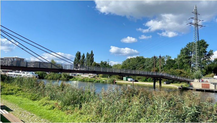
Hafenbrücke Geesthacht