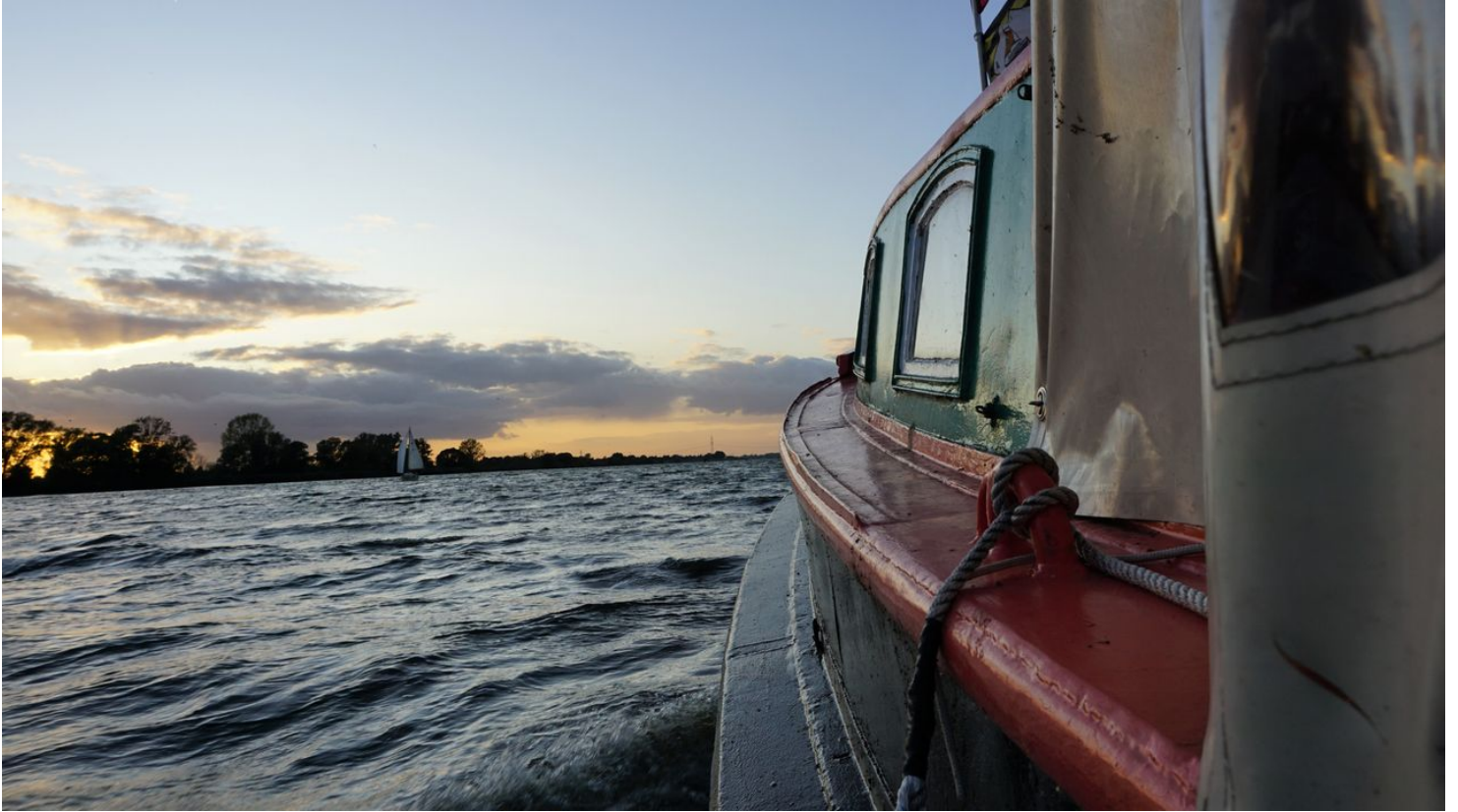
Stadtbarkasse "Piep" auf der Elbe