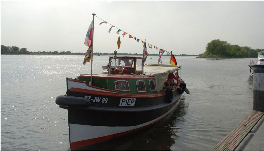
Stadtbarkasse "Piep" auf der Elbe