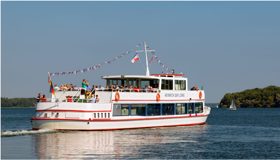
Schiff Heinrich der Löwe 1.jpg