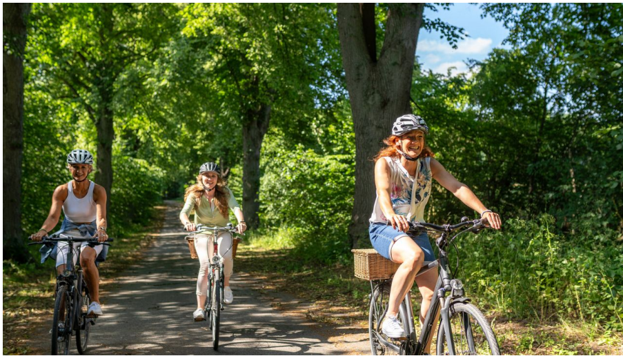
Ausflug mit dem Fahrrad Salem_Sh-Tourismus_MOCANOX.jpg