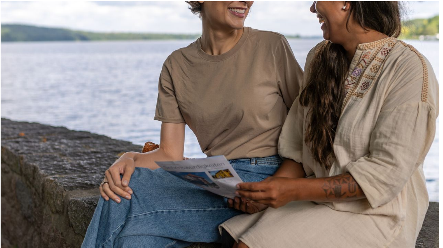
Blick auf den See in Ratzeburg_sh-tourismus_MOCANOX.jpg