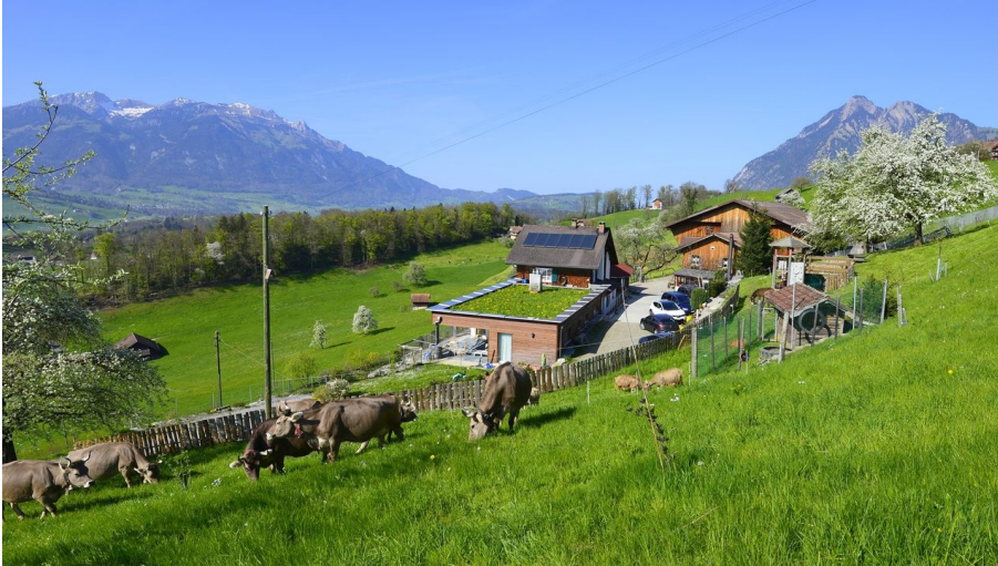
Erlebnisbauernhof Weid