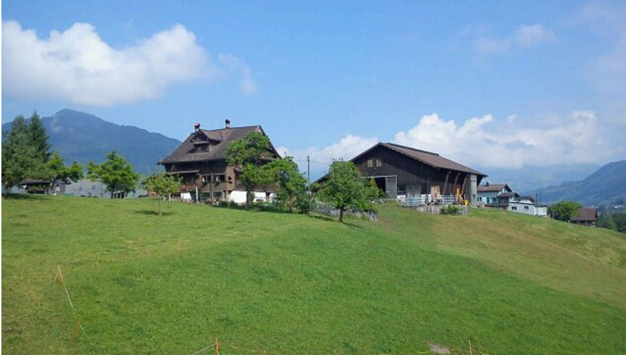
vorderer Degenberg