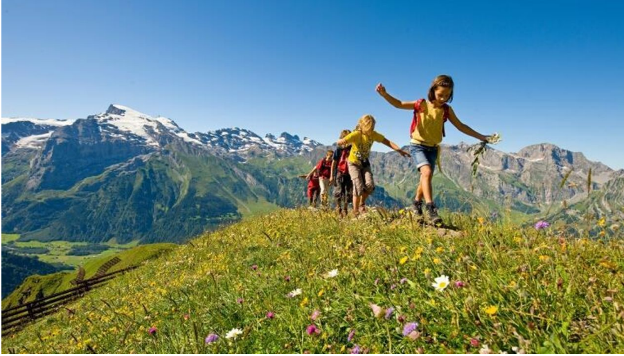
Schweizer Wandernacht