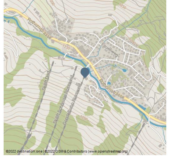
©2022 destination.one | ©2022 OSM & Contributors (www.openstreetmap.org)

Unterwegs durch die Landschaften Sörenbergs hören Sie in Entlebucher Dialekt Schauerhaftes, Mystisches und Legendäres aus längst vergangenen Zeiten: Zum Beispiel über die Erlösung eines Alpeistes