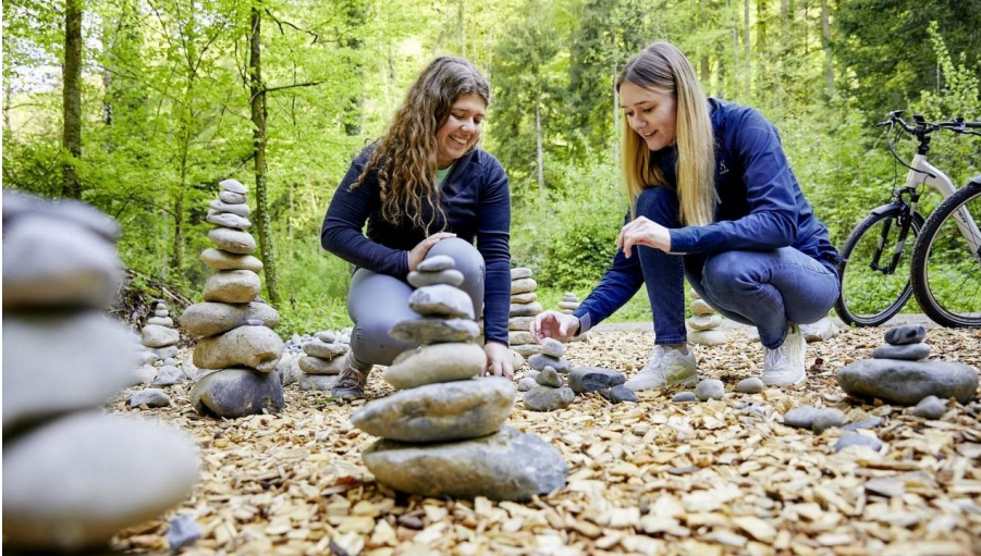
Csm Achtsamkeitstrail 63fa685ea1