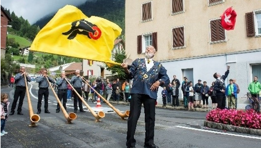
Alpabzug Wassen