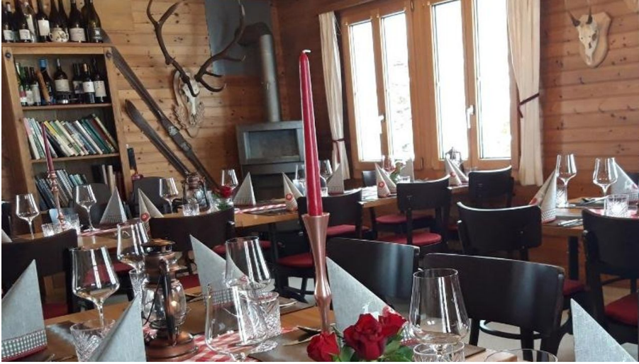
Alpsäuli Sunntig