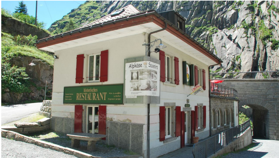
Restaurant Teufelsbrücke (1)