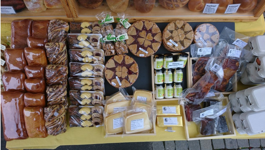
Regionale Produkte Buuremärt Willisau Alice Niederberger 2022 Tischli EN 7