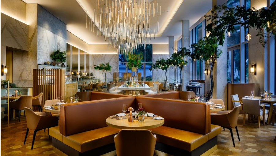
Cattani Collection - © GuideProxy