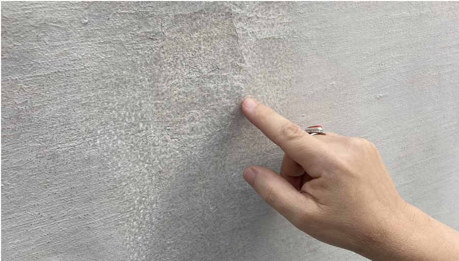
BP Restaurierung Riss vorne mit Hand